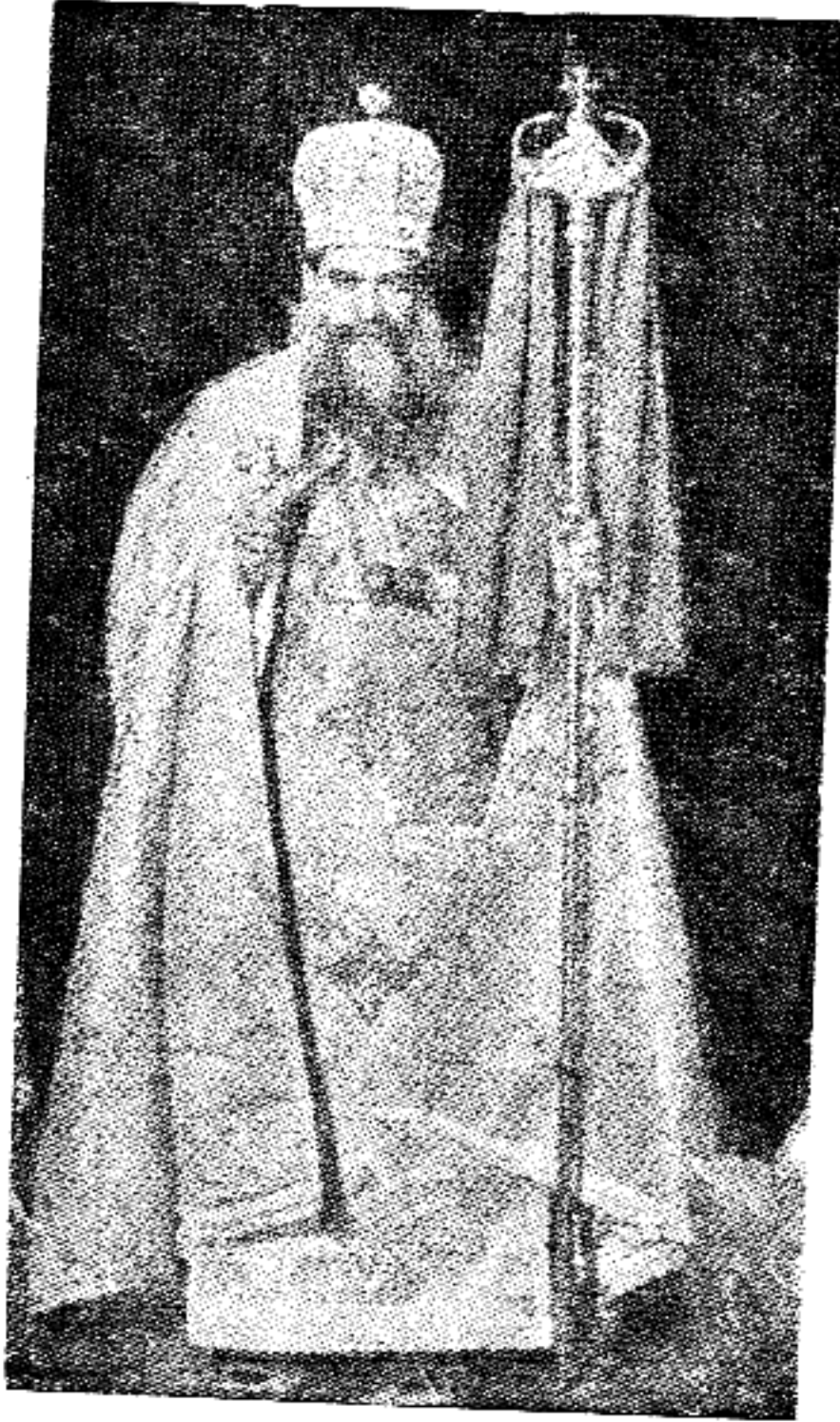
صاحب القداسة والغبطة البابا كيرلس السادس بابا الاسكندرية وبطريك الكرازة المرقسية